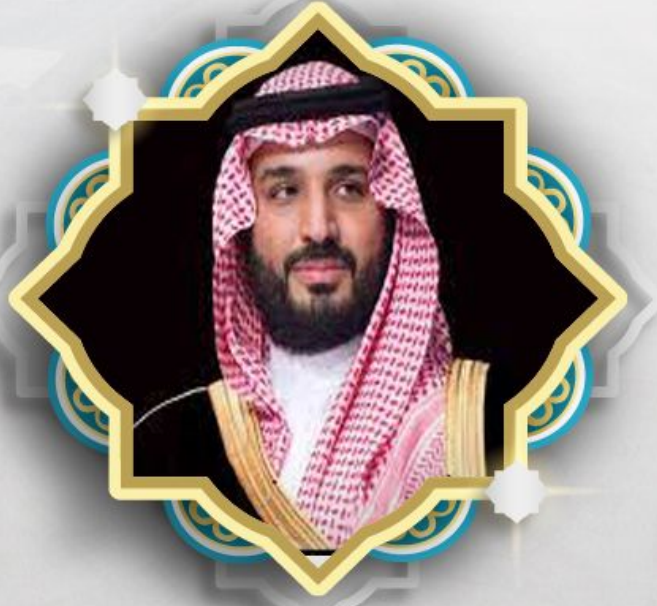
صاحب السمو الملكي الأمير/محمد بن سلمان بن عبدالعزيز آل سعود حفظه الله