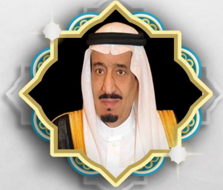
خادم الحرمين الشريفين الملك/سلمان بن عبدالعزيز آل سعود حفظه الله